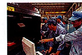
社員同士で学びあい、教えあい切迫取組

当社ではサポイン活動が社内の活性化ツールとして大いに機能している。チャレンジングなテーマを掲げ、新たな知見を得るために未経験の分野に切り込んで行く社風を作ることで、知的好奇心を刺激された若手社員が頑張り、ベテラン社員が支える姿が日常的に見られるようになった。また、簡単な設備は自分たちで作る機運が出てきたことも、多方面で良い効果をもたらしている。更に、大学や川下企業とのやり取りが増え、サポインが若手人材育成器となった。