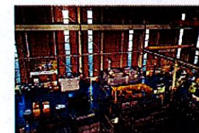
先端技術と手作り技術の一貫加工ライン

例えば中核設備の一つであるベンダー加工機では、ベンダー自身に独自の解析用回路を設けて、材料や形状に合わせた最適曲げ条件を、従来の職人技よりも短時間に、より精密に設定できるようにした。