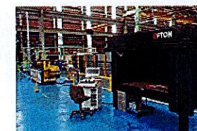
ベンダーと非接触3次元形状測定機の連携

高強度アルミニウムの加工では、ロット内やロット間の硬度ばらつきによるスプリングバック量の変動に注意する必要がある。加工後の製品を姿ゲージでチェックして、曲げ条件を微調整していく従来のやり方は、業務効率の悪化を招いていた。一貫加工ラインでは、全電動型のベンダーと非接触の3次元形状測定機をLANに接続することで、加工物を形状測定機に置くだけで自動計測して補正值を計算するとともに、LANを通じてベンダーに信号を送り、設定値を自動補正する仕組みをベンダーメーカーと共同で構築した。